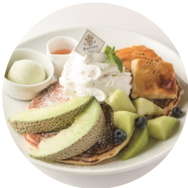
「ほこたメロンとクリームブリュレのパンケーキ」 ¥1,598 (Butter)