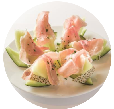
「銚田市産メロンと300日熟成生ハムの“ジャンボンメロン”」 ¥626 (Le Bar a Vin 52 AZABU TOKYO)