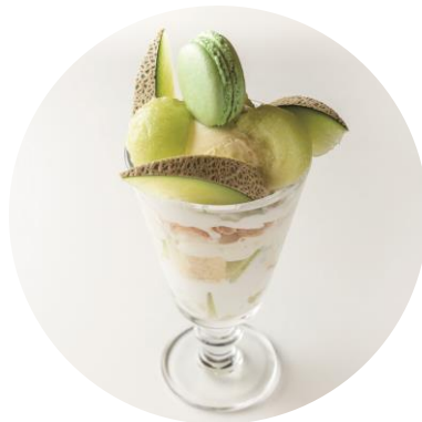
「リッチメロンパフェ」 ¥1,680 (tables cook & LIVING HOUSE)