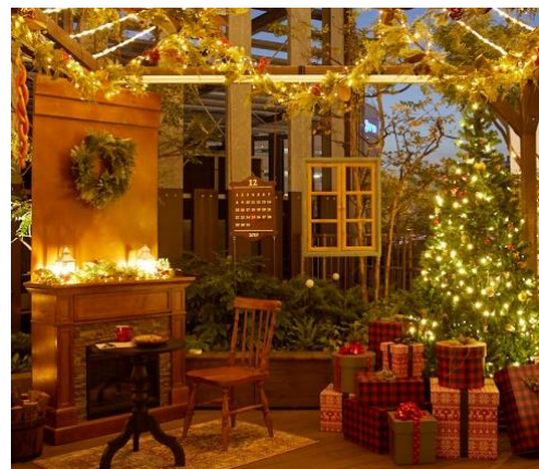
(上) 屋上庭園には「サンタの家」をイメージしたフォトスポットが登場。